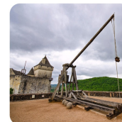
Bøn i Ånden